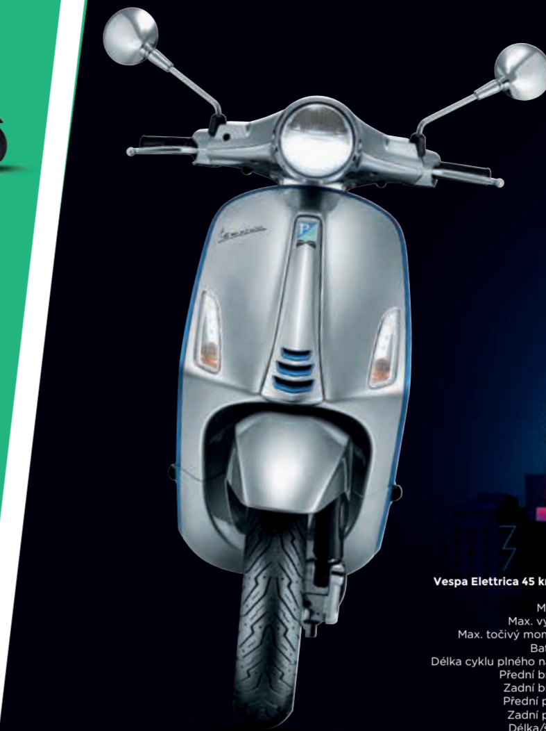
Vespa Elettrica 45 km/h

Motor: elektrický s rekuperací Max. výkon: 4,8 hp (3,5 kW) Max. točivý moment: 6 Nm při 5.500 ot/min Baterie: 4,2 kWh Lithium, 48V, 86 Ah Délka cyklu plného nabití: 4 hod. (při 220 V, za optim. podmínek) Přední brzda: Ø 200 mm kotouč Zadní brzda: Ø 140 mm buběn Přední pneu: 110/70 - 12" Zadní pneu: 120/70 - 12" Délka/šířka: 1.870/735 mm Rozvor: 1.350 mm Výška sedla řidiče: 790 mm Provozní hmotnost: ca. 130 kg Max. rychlost: - 45 km/h