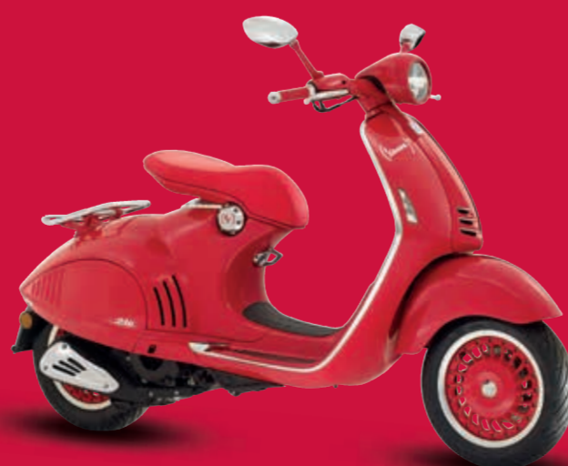
Vespa 246 RED 125