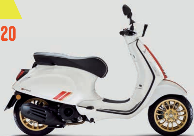
VESPA SPRINT RACING SIXTIES 50 / 125