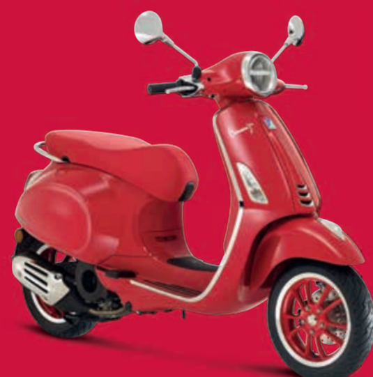
Vespa Primavera RED 125