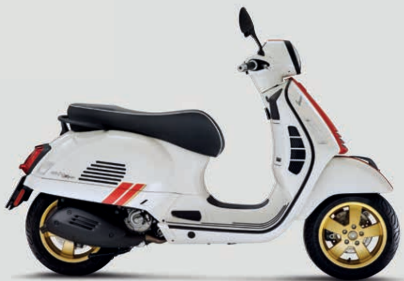
VESPA GTS SUPER RACING SIXTIES 125 / 300 hpe